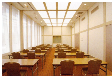
サルビア使用例/標準定員24名