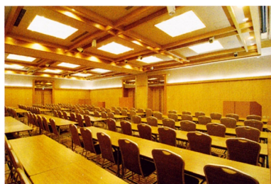
けやき使用例/標準定員120名

利用形態に応じて分割して利用できる会議室(けやき、サルビア)があります。 また、各種テーブルコーディネートやケータリングサービスを利用しての ご宴会やパーティーについてもご相談を承ります。