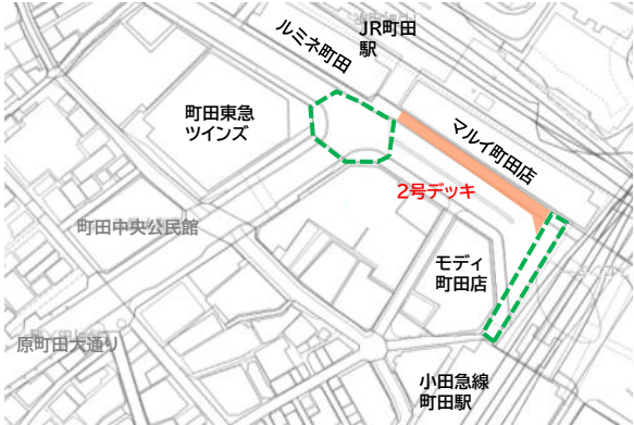
サイネージ設置箇所